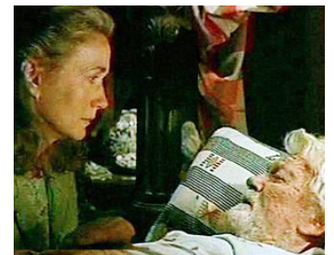
1991 LES ENFANTS DU NAUFRAGEUR de Jérôme Foulon avec Jean Marais