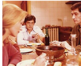
1975 LES FLEURS DU MIEL de Claude Faraldo avec Gilles Segal, Claude Faraldo