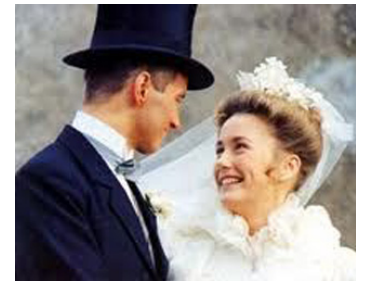
1967 LE GRAND MEAULNES de Jean-Gabriel Albicocco avec Jean Blaise