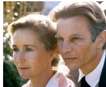
1983 AU NOM DE TOUS LES MIENS de Robert Enrico avec Michael York