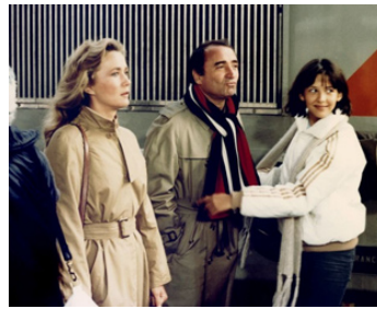
1980 LA BOUM de Claude Pinoteau avec Claude Brasseur, Sophie Marceau