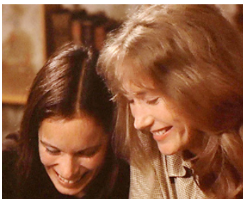
1978 MAIS OÙ EST DONC ORNICAR de Bertrand Van Effenterre avec Geraldine Chaplin