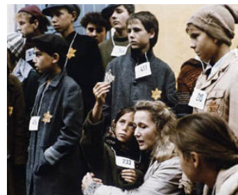
1991 LE CRI DU PAILLON (Postedni motyl) de Karel Kachyna avec Ingrid Held