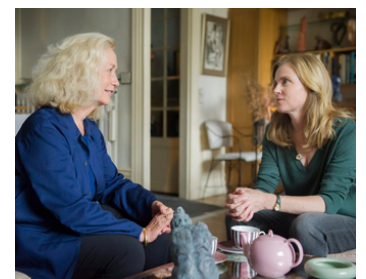
2018 UN ADULTÈRE de Philippe Harel avec Isabelle Carré