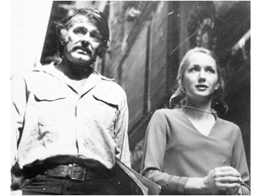
1972 L'HOMME QUI EST MORT 2 FOIS (The Man who died twice) de J. Sargent avec S. Whitman