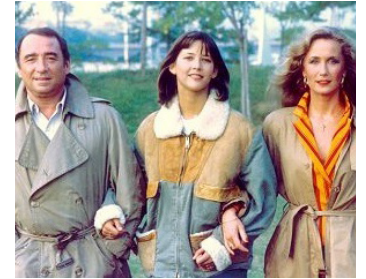
1982 LA BOUM 2 de Claude Pinoteau avec Sophie Marceau, Claude Brasseur