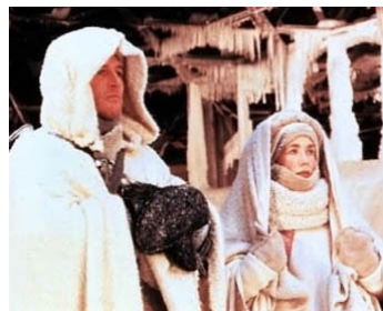
1978 QUINTET (Quintet) de Robert Altman avec Paul Newman