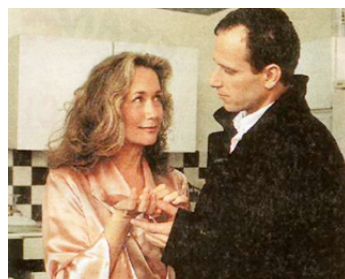
1996 UNE FEMME À SUIVRE de Patrick Dewolf avec Charles Berling