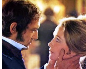
1970 RAPHAËL OU LE DÉBAUCHÉ de Michel Deville avec Maurice Ronet