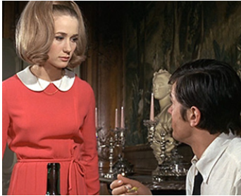
1968 ADIEU L'AMI de Jean Herman avec Alain Delon