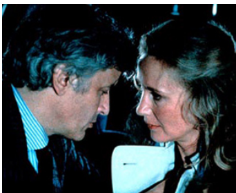
1988 CINÉMA PARADISO (Nuovo cinema Paradiso) de Giuseppe Tornatore avec Jacques Perrin