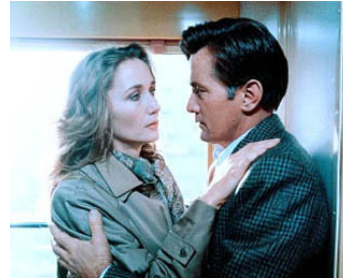
1982 ENIGMA (Enigma) de Jeannot Szwarc avec Martin Sheen