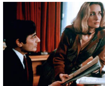
1976 L'HOMME QUI AIMAIT LES FEMMES de François Truffaut avec Charles Denner