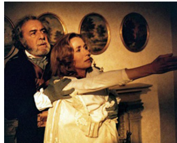
1983 UN AMOUR INTERDIT de Jean-Pierre Dougnac avec Fernando Rey