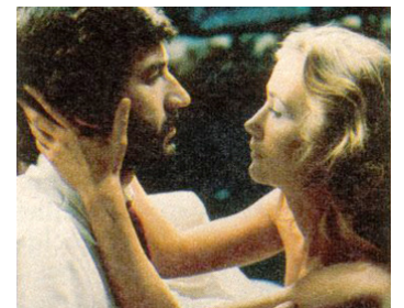
1979 LA TRIPLE MORT DU 3 e PERSONNAGE d'Helvio Soto avec José Sacristan