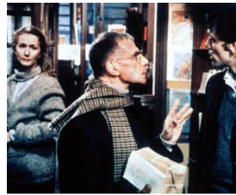
1980 UN MAUVAIS FILS de Claude Sautet avec Jacques Dufilho, Patrick Dewaere