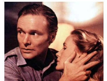
1977 LA CELLULE DE VERRE (Die gläserne Zelle) d'Hans W. Geißendörfer avec Helmut Griem