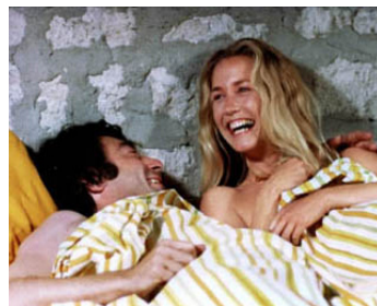
1976 LE PAYS BLEU de Jean-Charles Tacchella avec Jacques Serres