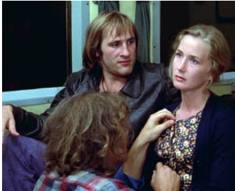
1973 LES VALSEUSES de Bertrand Blier avec Patrick Dewaere, Gérard Depardieu