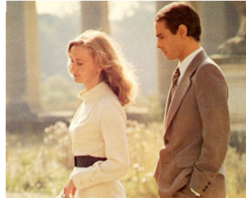
1973 L'IRONIE DU SORT d'Édouard Molinaro avec Pierre Clémenti