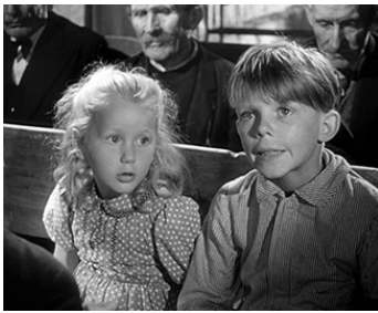
1952 JEUX INTERDITS de René Clément avec Georges Poujouly