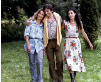
1981 CROQUE LA VIE de Jean-Charles Tacchella avec Bernard Giraudeau, Carole Laure