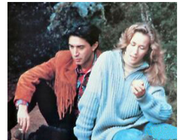
1983 LE JEUNE MARIÉ de Bernard Stora avec Richard Berry