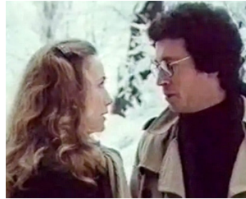
1982 L'IMPÉRATIF (Imperativ) de Krzysztof Zanussi avec Robert Powell